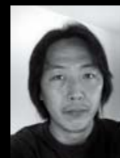
Designed by M. Tanabe